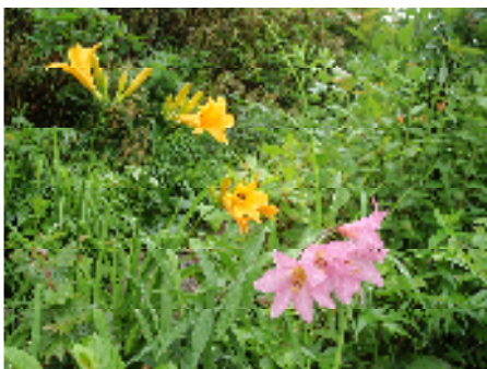
ニッコウキスゲとヒメサユリ

浅草岳にこの時期にしか咲かないヒメサユリを鑑賞しに行くツアーです。 前泊もできます。 行程も楽になりますのでふるってご参加ください。